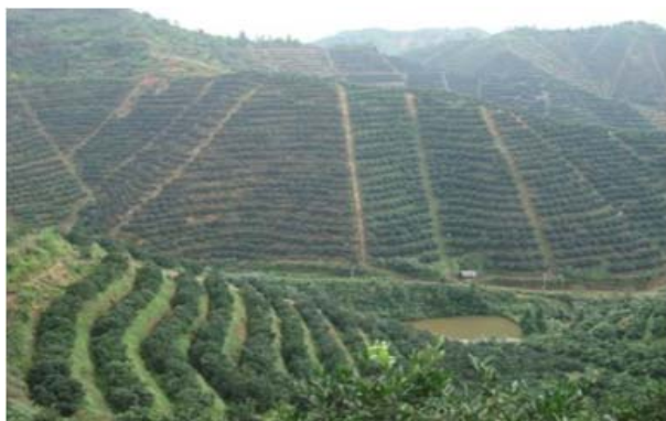
图1 山区、丘陵地形地貌

作业工具对搭载方式的需求。高巧明等 [7] 设计了一种挂载悬挂装置的电动履带底盘(如图3所示),并利用RecurDyn软件进行了两种路面下的动力学仿真分析,验证了其在复杂地形下的行驶性能。周承成等 [8] 也设计了一种小型履带式底盘,通过RecurDyn软件进行了动力学仿真分析,并通过实试验验证了设计的可行性。这些研究不仅展示了履带底盘设计的创新性,也验证了仿真分析在设计验证中的有效性。