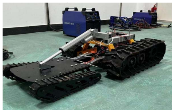
图4 两段式履带底盘

机械动力底盘液压系统是连接作业模块的关键的设计内容,能够有效的提高其在丘陵山地的作业性能。王鹏等 [11] 种液压控制、机械传动的丘陵山地果园动力底盘,利用AMESim仿真软件建立了液压系统模型,验证了其在复杂地形条件下的作业性能。不同的连接方式所需要的结构不同,在设计相关搭载平台时也要考虑作业模块的需求,完成整体化设计。