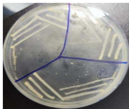
图1 分离菌株在TSA培养基上的菌落形态 2.2 革兰氏染色镜检结果