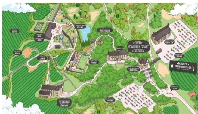
图2 熊猫猪猪乐园整体概况

在规模化养殖和文旅融合的基础上,公司进一步延伸产业链,构建了“生态养殖—食品加工—文化体验”的全产业链模式,开发了金华火腿、两头乌系列文创和大健康产品,提升了品牌市场认知度。同时,公司还建设了2000吨肉制品观光工厂,让消费者直观了解全产业链流程,增强了品牌体验和销售市场。